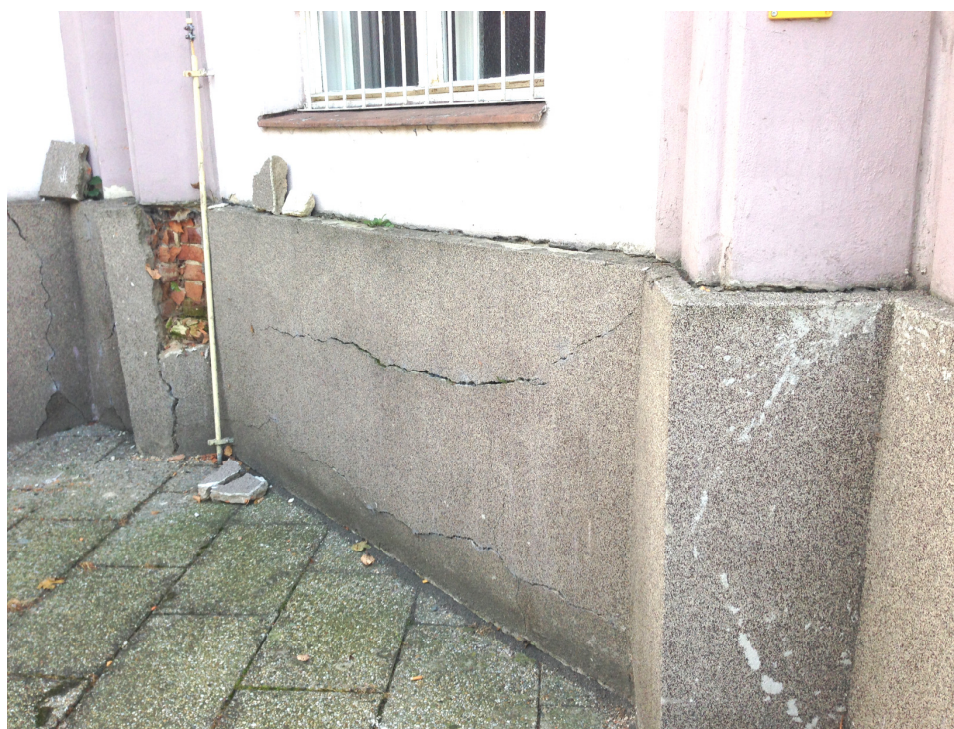
stávající rozpadlý sokl hlavní budovy divadla

popis stávajícího stavu: Stávající soklovou část tvoří betonová monolitická deska tl.cca 10cm na kterou byla nanесena stěrka marmolitová. Po našem průzkumu jsme zjistili, že stávající vodorovná izolace budovy je až ve výšce +1m nad stávajícím chodníkem, což zapříčiňuje to, že spousta vlhkosti ze základových konstrukcí narušuje monolitickou desku stávajícího soklu. Na spoustě místech je již tato deska vyvrácená nebo nabotnalá tím jak mokré cihelné zdivo pod deskou stále dokola v zimním období zamrzá a rozpadá se. viz foto