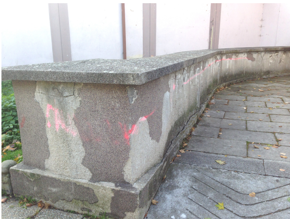
zídky bočních vstupů s narušenou omítkou - 2kusy

K o v a ř í k P e t r , J e ž n i c k á č. 43, K r n o v , t e l : 7 7 7 / 1 1 5 8 5 9 M e i l : p e t a . k o v a r i k @ c e n t r u m . c z